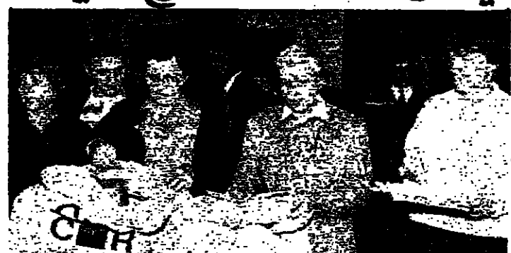
عقائد المخطفين ورسائل التأييد من لبنان وسوريا قبل المؤتمر الصحفي بمجموعتين